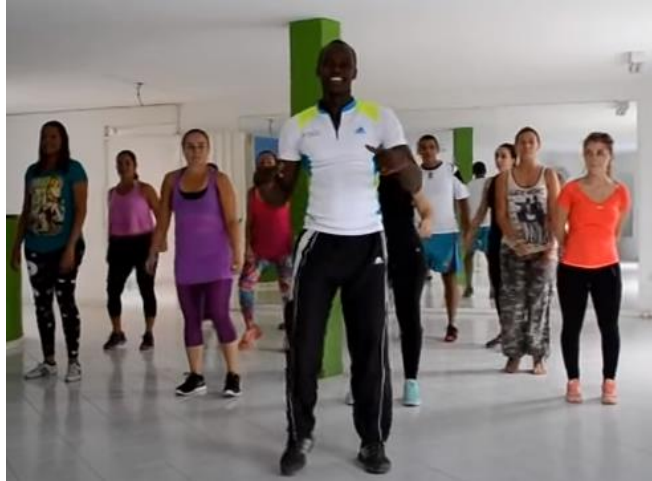
Salsa choke LIMON CON SAL

Link: https://www.youtube.com/watch?v=GfiePGy6fkl