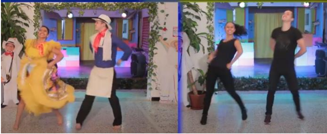
Bailar Pasillo Fiestero