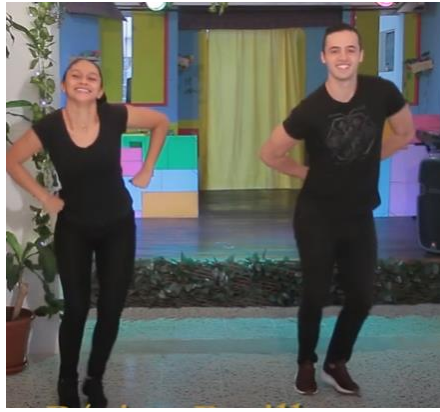
Bailar Pasillo Fiestero

Link: https://www.youtube.com/watch?v=alz-ip5D5_M